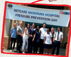
Pretoria, Jihoafrická republika