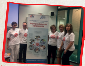
Plzeň, Česká republika